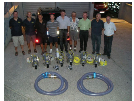
Bild 3: Übergabe der neuen Pumpen an die FF Günselsdorf und an die Nachbar Feuerwehren